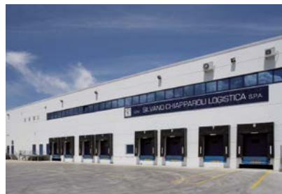
Centri di Cavezzo e Anagni